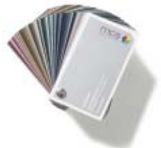
Métallisé/ Eisenglimmer (Pulverlack) Duroclear-Farbfächer mcs metallic colour system®